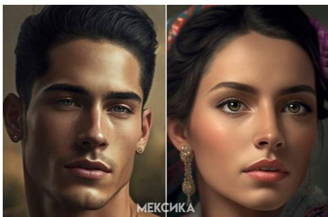
Изображения людей для маркетинговых нужд